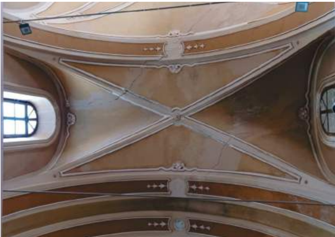
Lesioni seconda campata