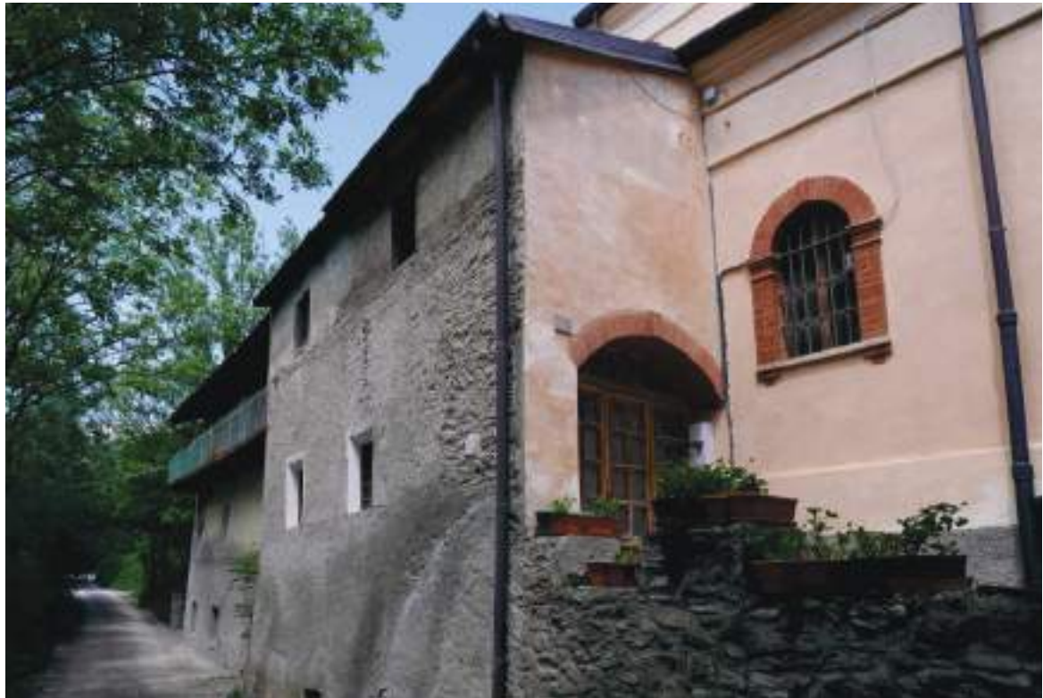
05. Vista della chiesa da sud.

Arch. Edoardo Schiari – C.F. SCHDRD93A28L727I – Via Levis 40, Chiomonte (TO)