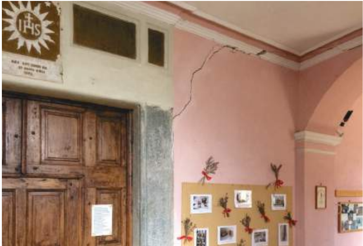
15. Esempio di fessurazione interna alla chiesa.

Arch. Edoardo Schiari – C.F. SCHDRD93A28L727I – Via Levis 40, Chiomonte (TO)