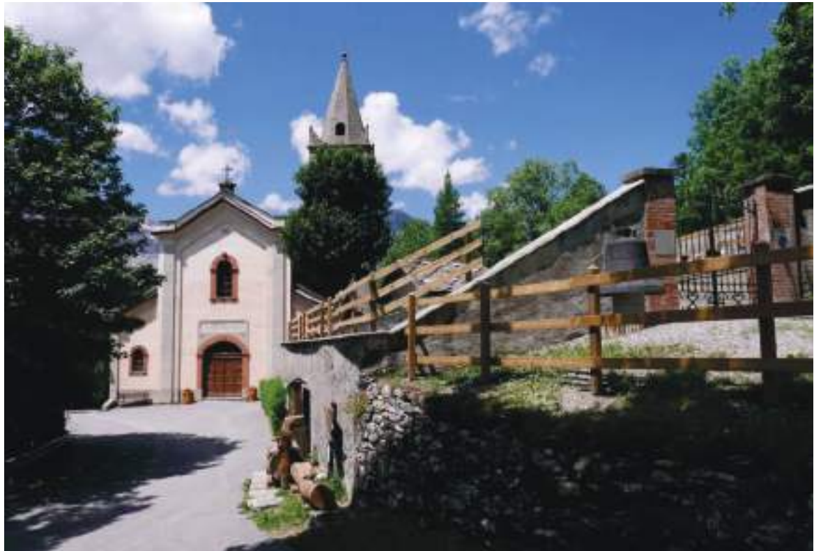
01. Vista della chiesa da est.

Arch. Edoardo Schiari – C.F. SCHDRD93A28L727I – Via Levis 40, Chiomonte (TO)