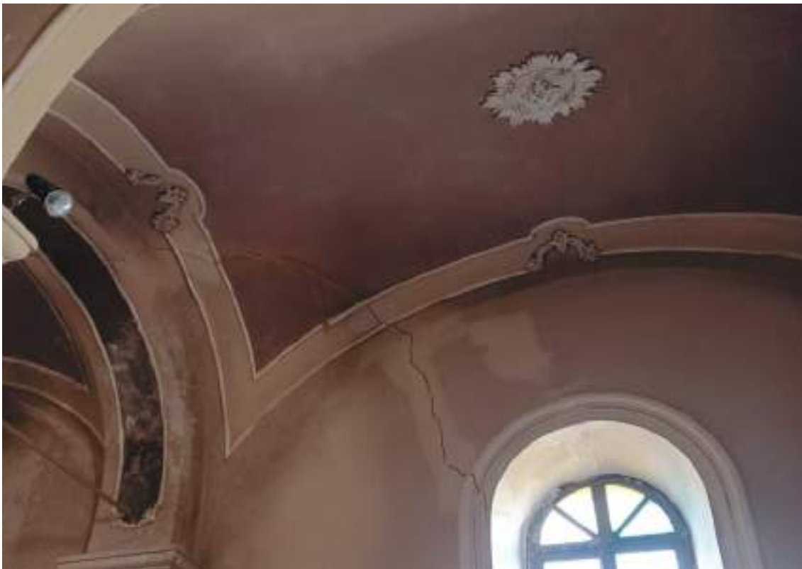
Lesioni navata laterale, seconda campata