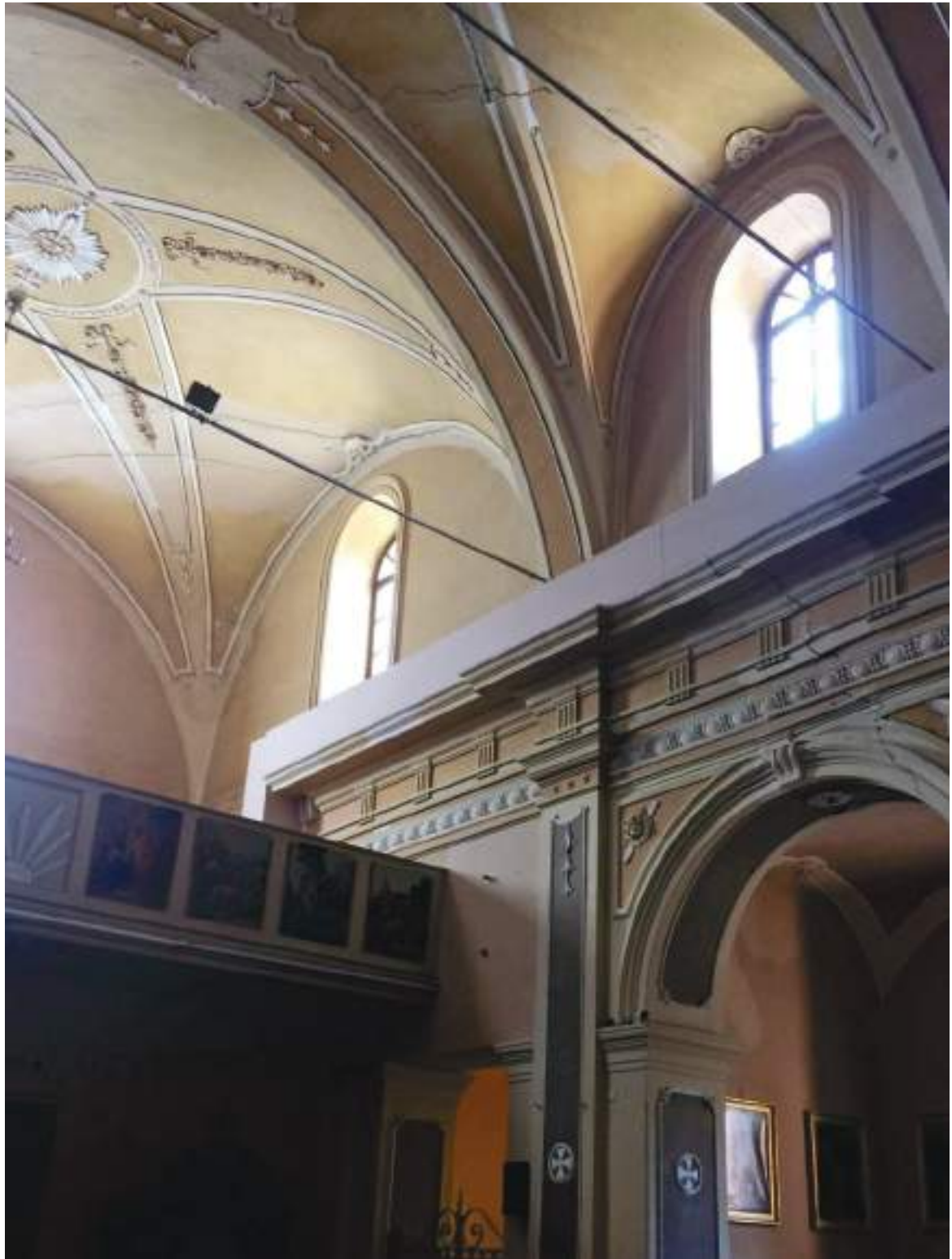
13. Dettaglio dell'interno verso la cantoria. Si notino le fessurazioni in corrispondenza delle volte.

Arch. Edoardo Schiari – C.F. SCHDRD93A28L727I – Via Levis 40, Chiomonte (TO)