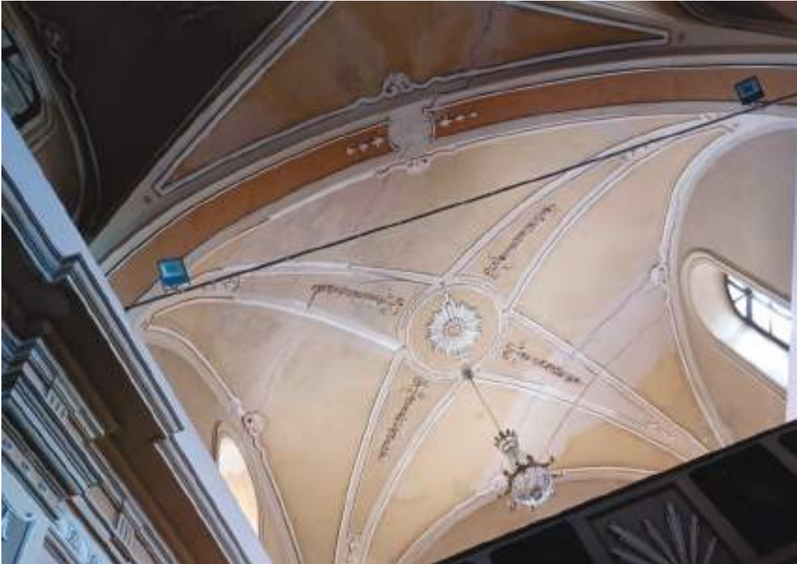
Lesioni prima campata

Arch. Edoardo Schiari – C.F. SCHDRD93A28L727I – Via Levis 40, Chiomonte (TO)