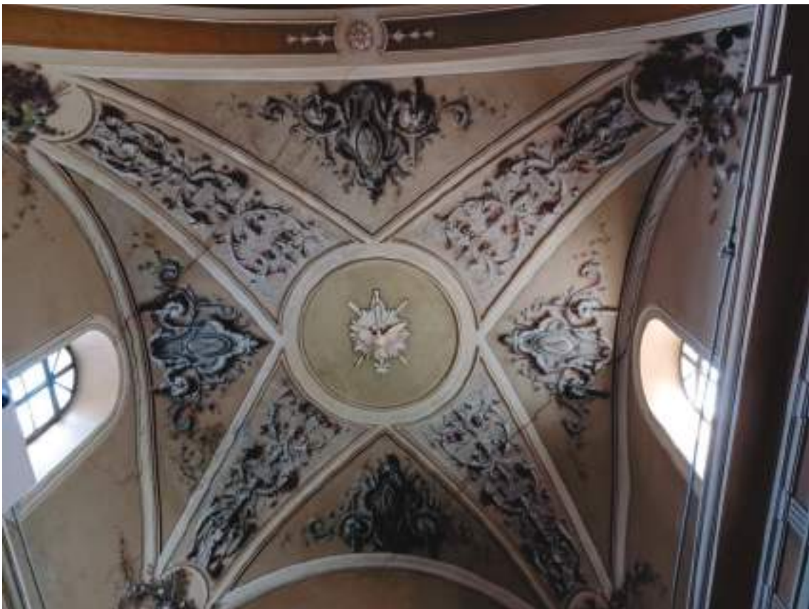
Lesioni ultima campata