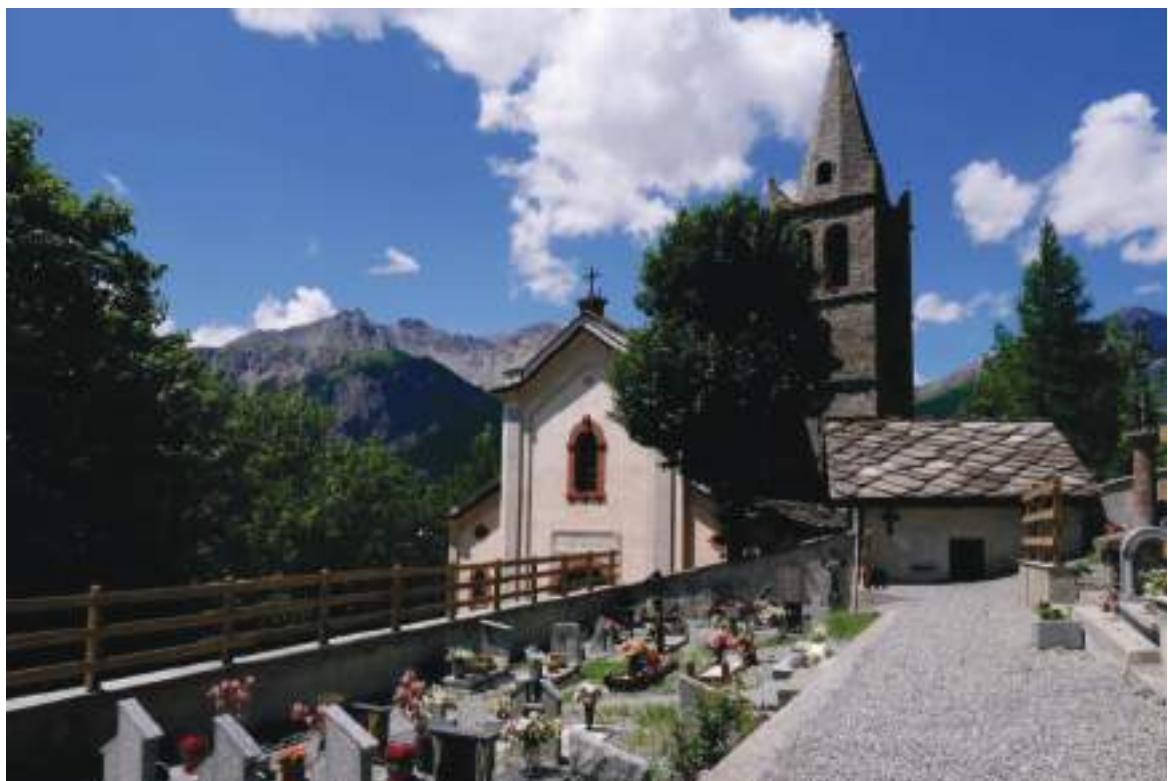
02. Vista della chiesa da nord est.