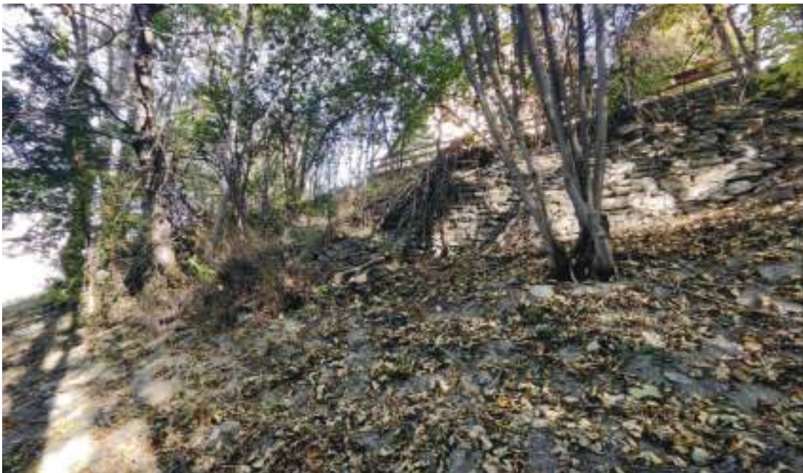
Vista del muro verso ovest