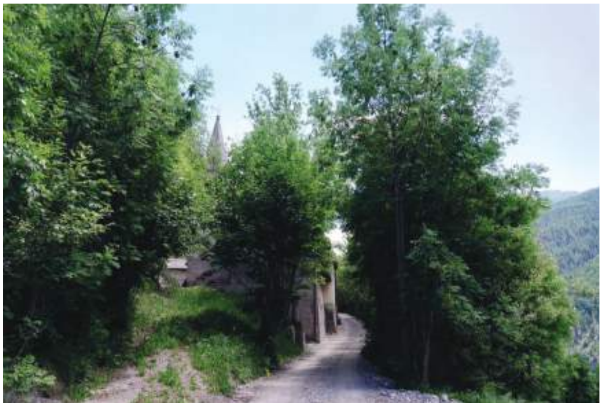
04. Vista della chiesa da ovest.