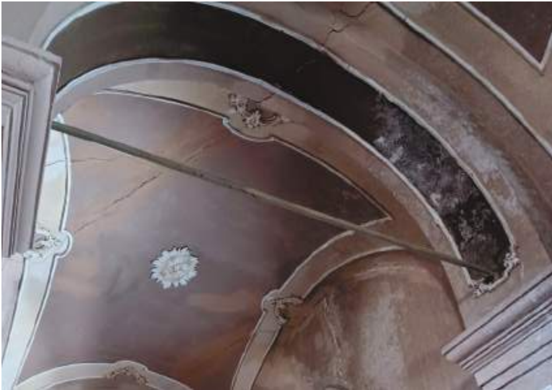
Lesioni navata laterale – prima campata

Arch. Edoardo Schiari – C.F. SCHDRD93A28L727I – Via Levis 40, Chiomonte (TO)