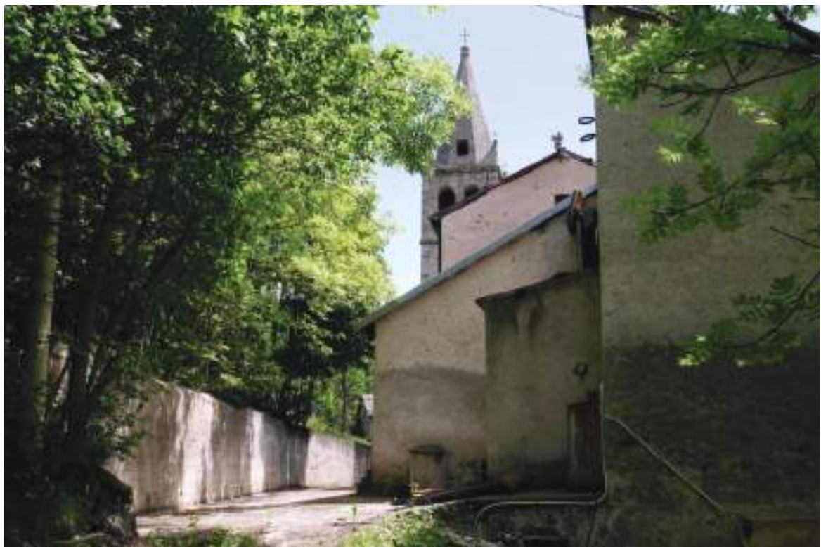
09. Prospetto ovest, vista del muro controterra già realizzato in nel passato.