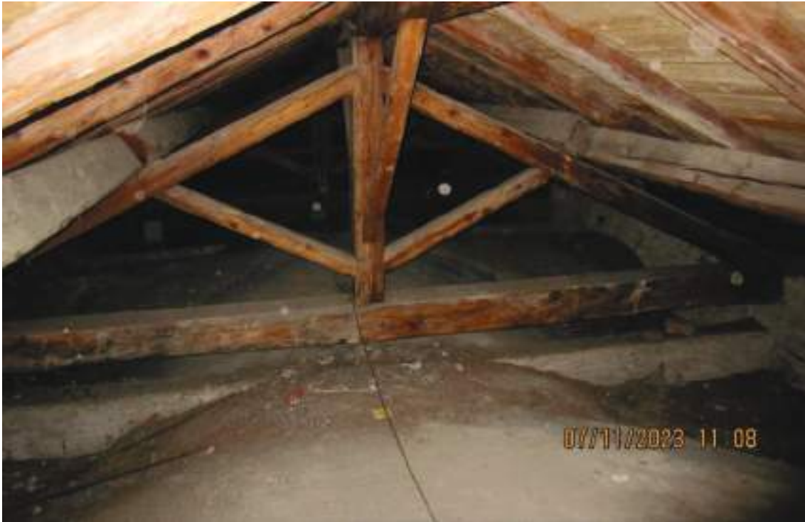
Vista dell'interno del sottotetto