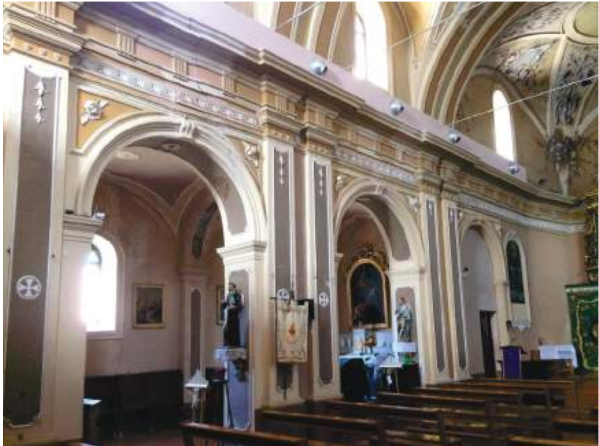
11. Vista dell'interno, verso la navata laterale sud.

Arch. Edoardo Schiari – C.F. SCHDRD93A28L727I – Via Levis 40, Chiomonte (TO)