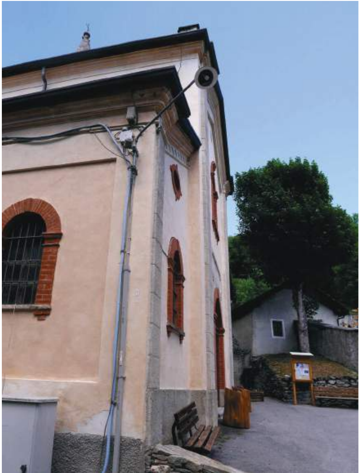
07. Dettaglio dello spigolo sud est.

Arch. Edoardo Schiari – C.F. SCHDRD93A28L727I – Via Levis 40, Chiomonte (TO)