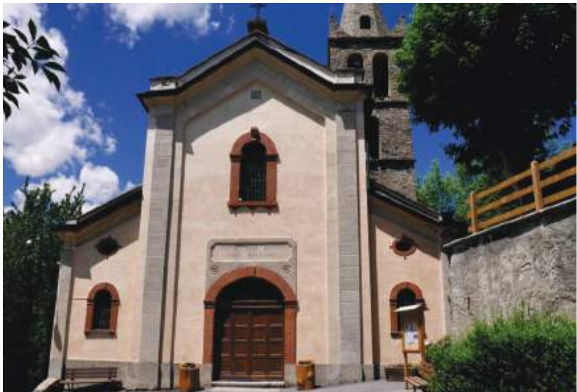
06. Vista del fronte principale della chiesa.