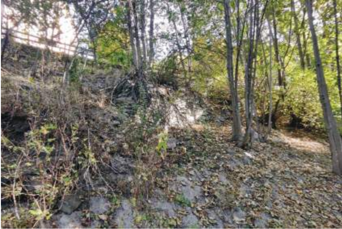
Vista del muro verso est