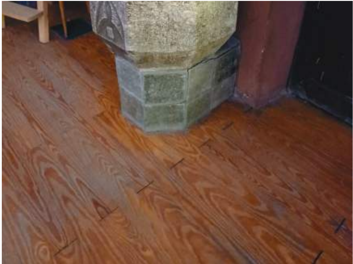
17. Pavimentazione chiesa

Arch. Edoardo Schiari – C.F. SCHDRD93A28L727I – Via Levis 40, Chiomonte (TO)