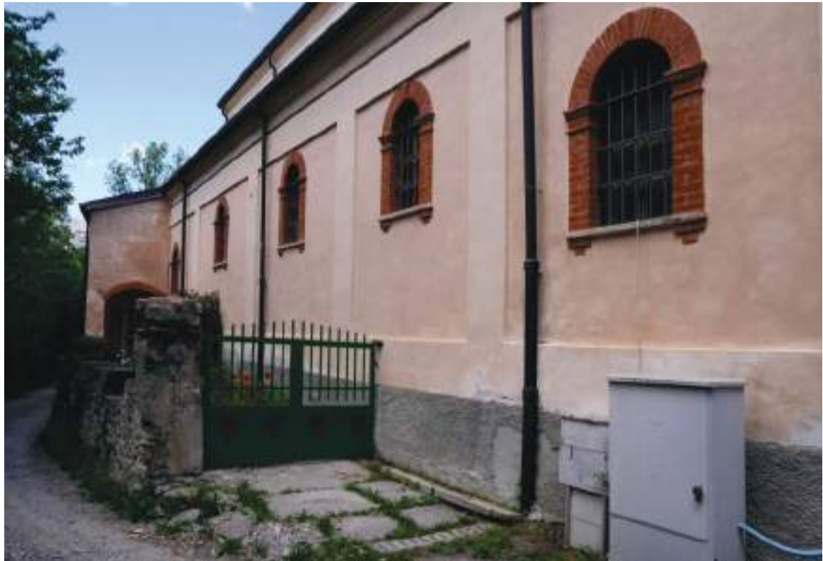
08. Dettaglio del prospetto sud.

Arch. Edoardo Schiari – C.F. SCHDRD93A28L727I – Via Levis 40, Chiomonte (TO)