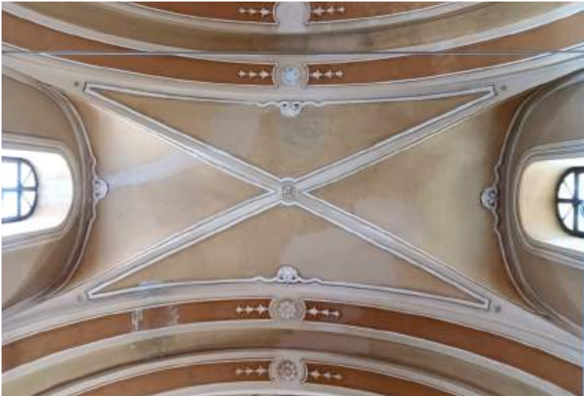
Lesioni terza campata

Arch. Edoardo Schiari – C.F. SCHDRD93A28L727I – Via Levis 40, Chiomonte (TO)