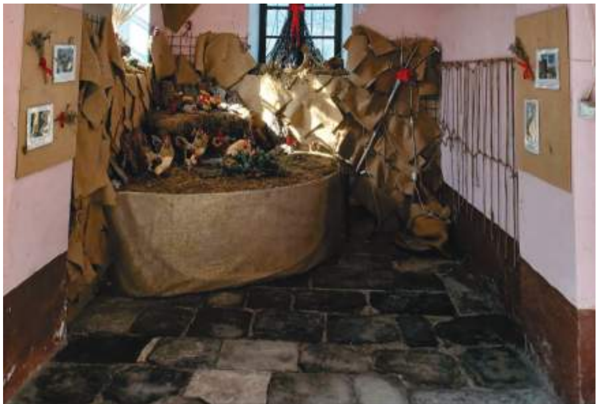
16. Pavimentazione pronao di accesso