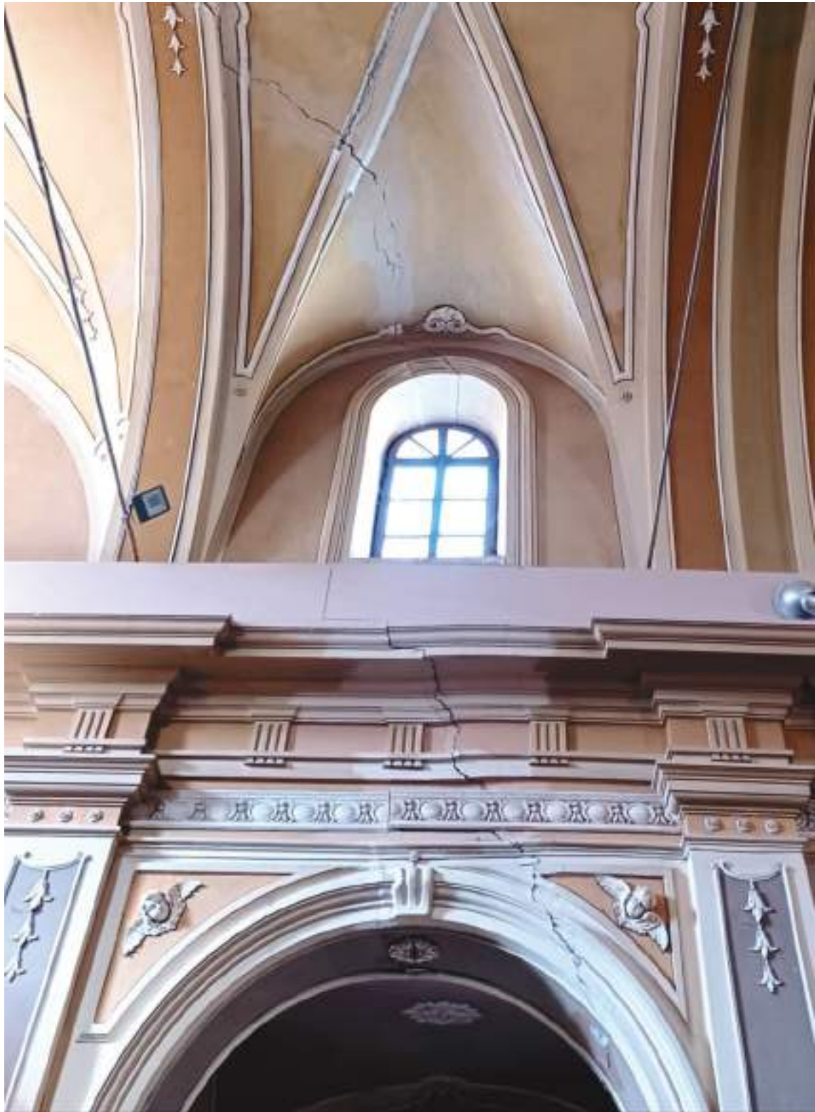
14. Arco maggiormente fessurato all'interno della chiesa.

Arch. Edoardo Schiari – C.F. SCHDRD93A28L727I – Via Levis 40, Chiomonte (TO)