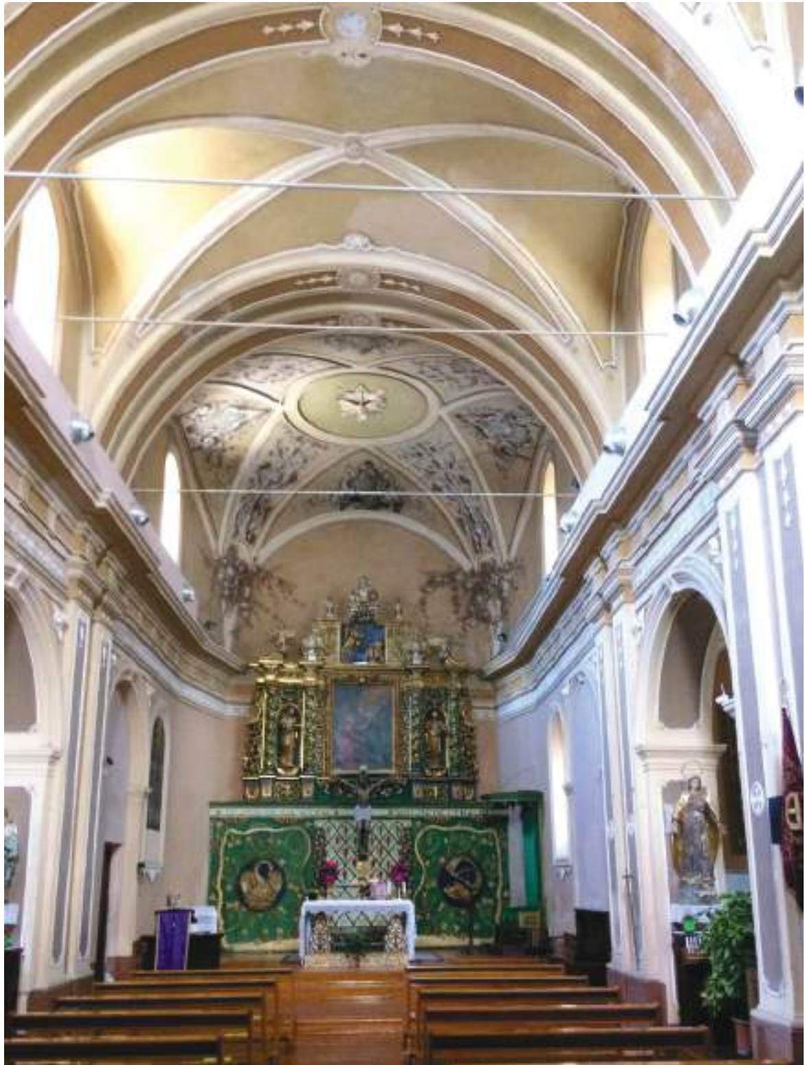
12. Vista dell'interno, navata principale verso l'altare.

Arch. Edoardo Schiari – C.F. SCHDRD93A28L727I – Via Levis 40, Chiomonte (TO)