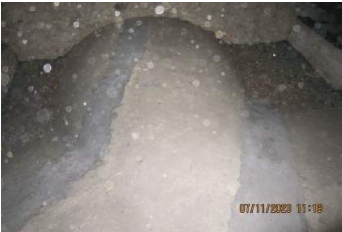
Vista delle fessure sigillate nel 2006