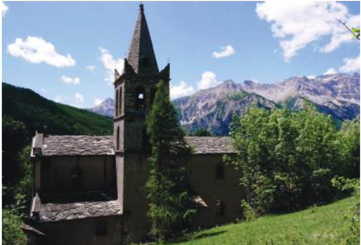
03. Vista della chiesa da nord.

Arch. Edoardo Schiari – C.F. SCHDRD93A28L727I – Via Levis 40, Chiomonte (TO)