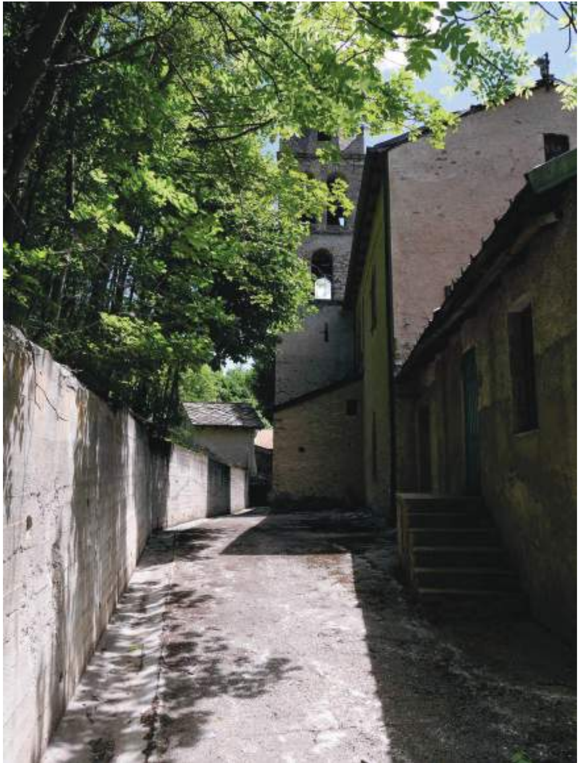
10. Vista da ovest verso il campanile.

Arch. Edoardo Schiari – C.F. SCHDRD93A28L727I – Via Levis 40, Chiomonte (TO)