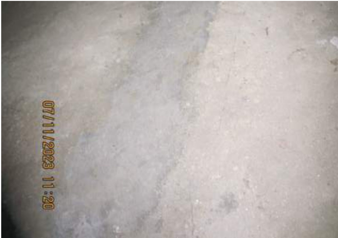
Dettaglio lesioni: fessurazione comparsa in adiacenza alla sigillatura del 2006